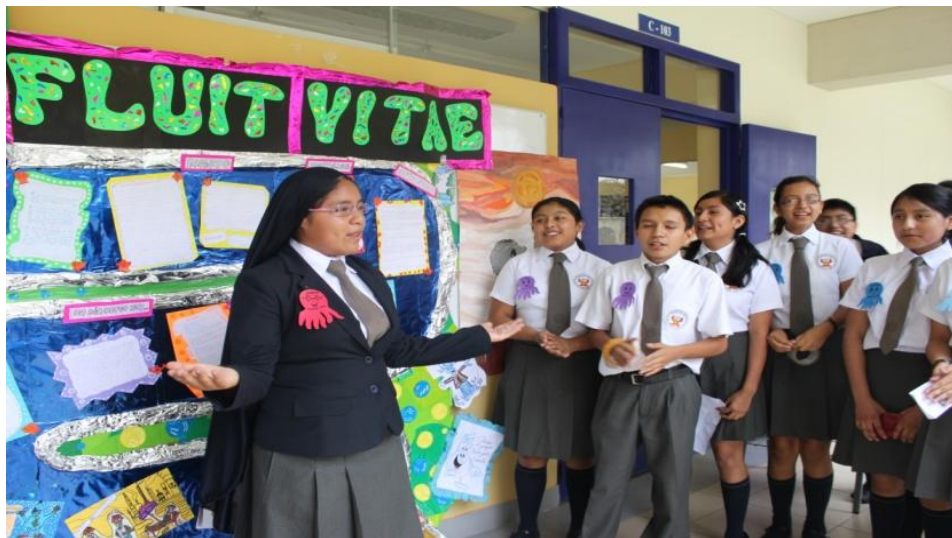
En el Colegio Mayor se reconoce y valora la diversidad cultural