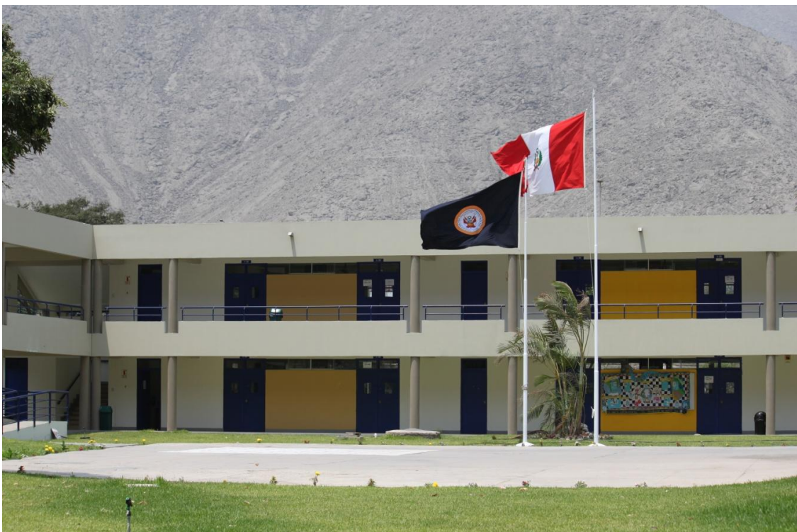
Funcional y cómoda infraestructura educativa