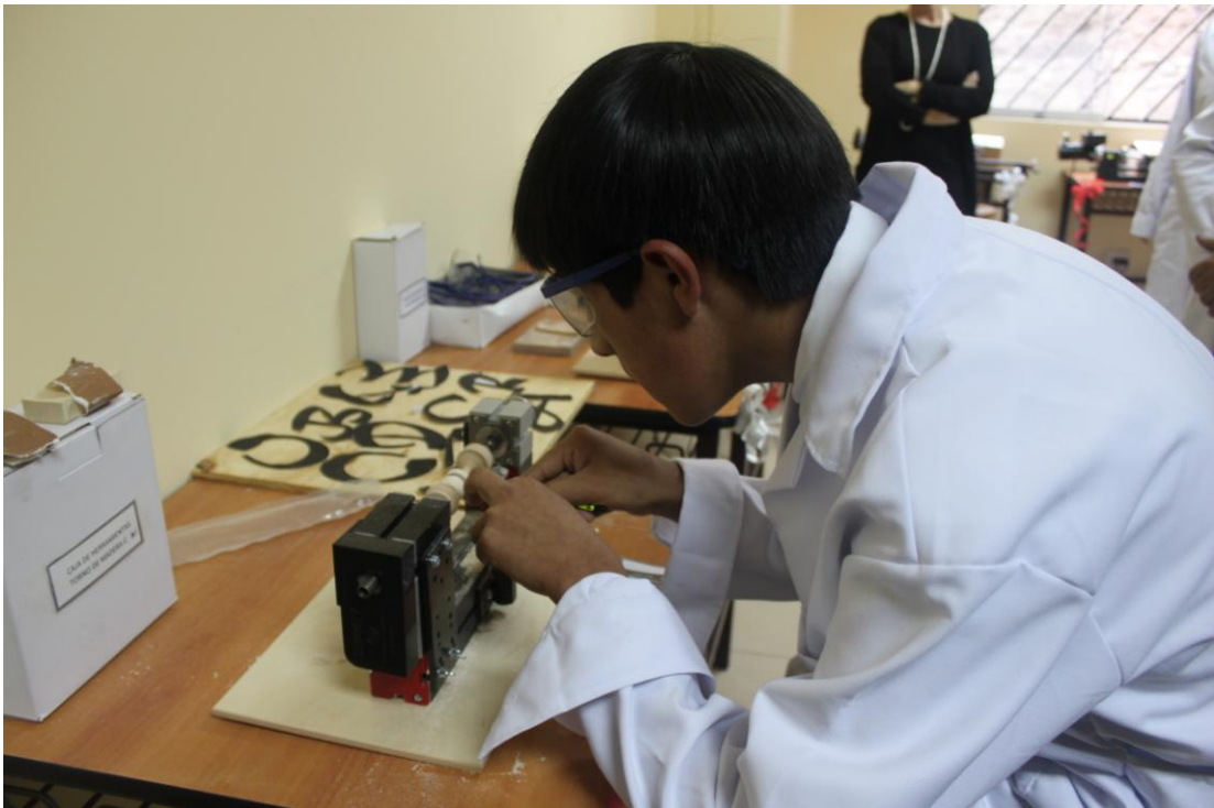
Laboratorios y talleres implementados de acuerdo a estándares internacionales