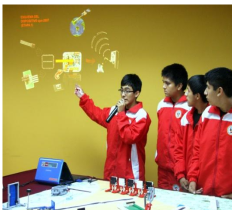
Equipo de robótica del CMSPP

El estudiante del Colegio Mayor es un ciudadano del conocimiento y la información. Participa en su comunidad, no sólo a través de las actividades propias del estudio, como investigar, debatir y crear, sino también en actividades de responsabilidad social.