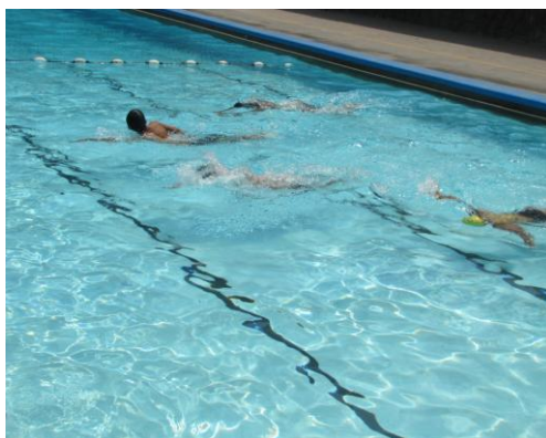
El deporte y la actividad física son parte de la formación integral en el Colegio Mayor

Los docentes son profesionales de trayectoria nacional e internacional, con principios éticos y con participación destacada en el campo de la educación. Además, connotadas personalidades del conocimiento científico y tecnológico compartirán con los estudiantes sus experiencias y su visión de vida.