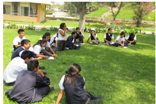
Uso de espacios alternativos para el aprendizaje