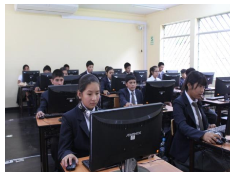
Cada estudiante optimiza sus aprendizajes haciendo uso de tecnologías modernas

Aplicadas al campo pedagógico, las tecnologías de la información y comunicación tienen como objeto racionalizar los procesos educativos, mejorar los resultados del sistema escolar, asegurar nuevas formas de aprendizaje y promover la interactividad.