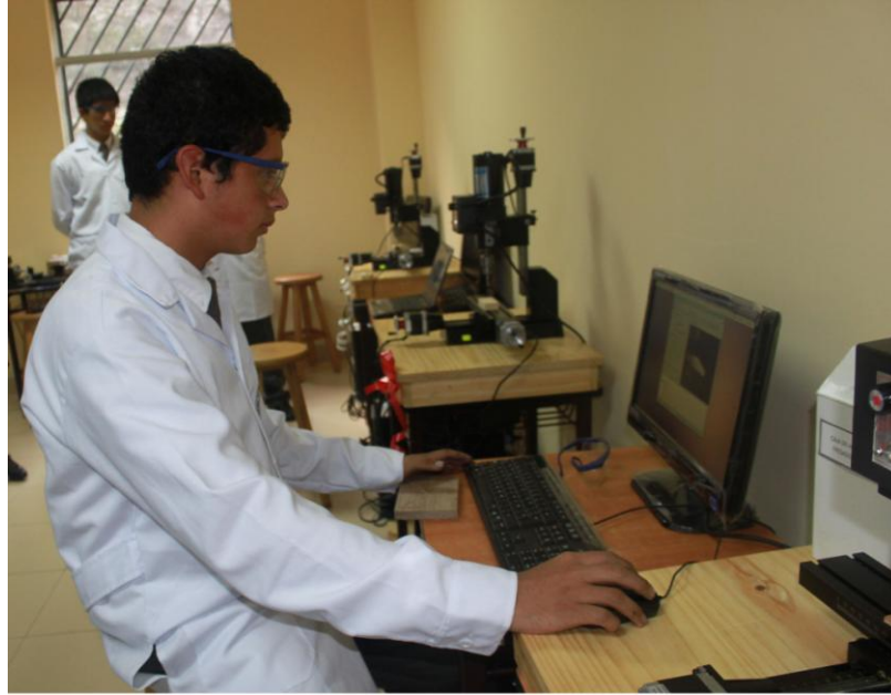
Los estudiantes realizan investigaciones de nivel universitario