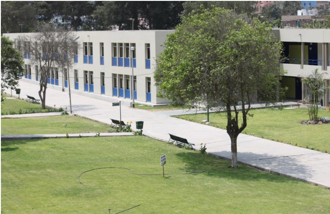
Amplia infraestructura con extensas áreas verdes